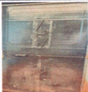
Foto 5: SE OBSERVA LA FINALIZACION DE SUSTITUCION DE PUERTA OXIDADA